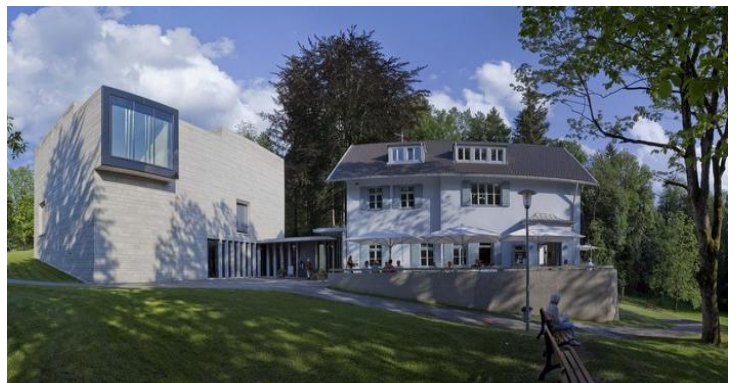
Franz Marc Museum in Kochel

Im Anschluss gönnen wir uns eine Kaffeepause im traditionsreichen Restaurant direkt am Kochelsee und fahren am späten Nachmittag nach Regensburg zurück.