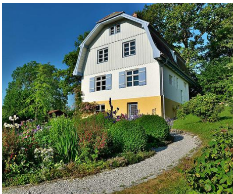
Gabriele Münter Haus in Murnau

Anschließend fahren wir weiter nach Kochel am See und lernen das Franz Marc Museum kennen. Das ursprüngliche Museum in einer Villa in der Nähe von Franz Marcs einstigem Wohnsitz, wurde 2008 um einen modernen Bau und damit um Werke des Brücke-Expressionismus, zahlreicher Werke Paul Klees und die Malerei der Nachkriegsabstraktion erweitert.